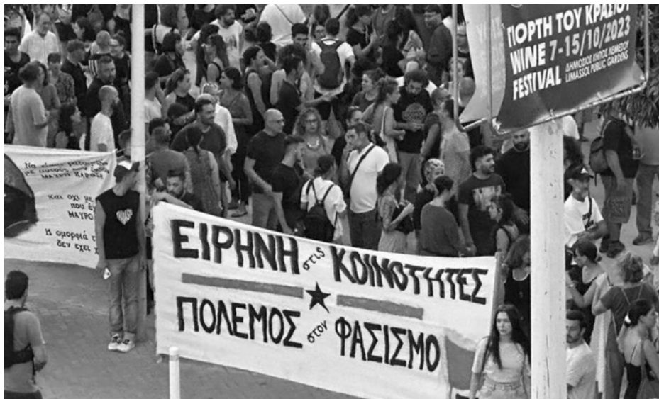
Το συγκεντρωμένο πλήθος στο ΓΣΟ

Μετα το τέλος της πορείας, ανακοινώθηκε πως υπήρχαν συλλήψεις συντρόφων πριν καν ξεκινήσει η πορεία και καλέστηκε αυθόρμητη συγκέντρωσή έξω από το αστυνομικό τμήμα της Λεμεσού. Παρά την προσπάθεια αποτροπής της συγκέντρωσης από τους μπάτσους έξω απο το τμήμα, στην συγκέντρωση συμμετείχαν περίπου 100 άτομα, τα οποία φώναζαν συνθήματα και έμειναν εκεί μέχρι την ώρα που οι κρατούμενοι σύντροφοι αφέθηκαν ελεύθεροι.